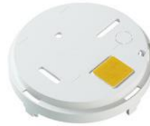
Ein- und Zweilochmontage